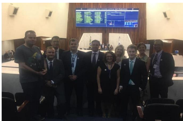
Trabalho intensificado: assessores e membros da direção da Assejur acompanharam, em todas as suas etapas, a tramitação da PEC nº 10/2019, que criou o cargo de consultor jurídico

Todo o processo legislativo vinculado à PEC nº 10/2016 foi acompanhado de perto pela Assejur. A questão ganhou destaque nos planos estratégicos da associação nos três últimos anos. Um trabalho intenso marcou a presença de assessores jurídicos em debates realizados pelo Órgão Especial sobre o sistema de cargos e salários do Tribunal de Justiça e no CNJ, que também analisou a matéria. Durante esse período, vários documentos consolidaram a defesa das prerrogativas da carreira , baseados em deliberações da assembleia geral. Nas sessões de votação da PEC nº 10/2019, membros da categoria e da direção da entidade de classe estiveram no plenário da Assembleia Legislativa.